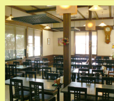
本館・レストラン