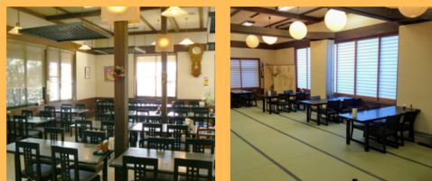
本館・レストラン