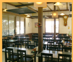
本館・レストラン