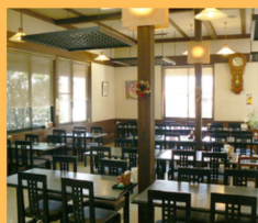
本館・レストラン