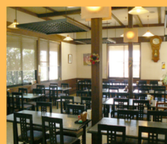
本館・レストラン