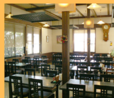
本館・レストラン